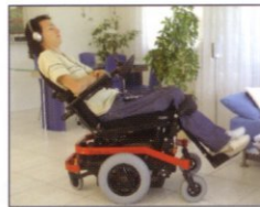
Für alle Rollstuhltypen