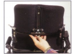
Einfaches Abnehmen und Wiederanbringen