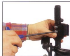
Einfach zu installieren