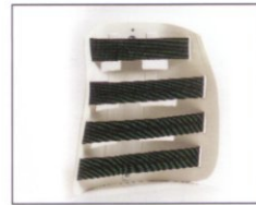
Profileinstellung durch Innengurte