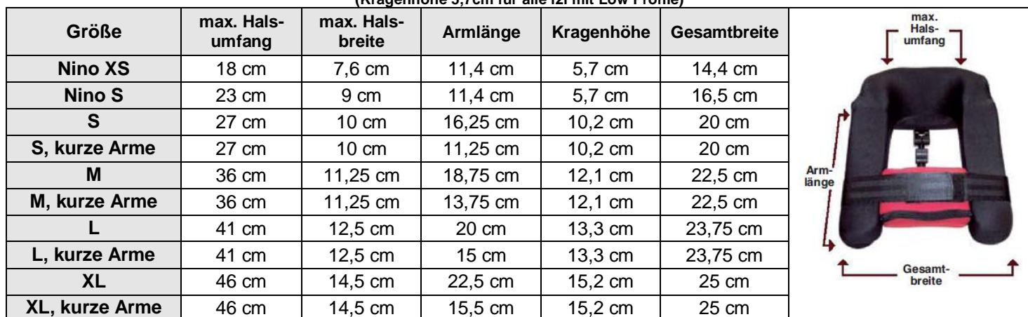
Maßtabelle (Kragenhöhe 5,7cm für alle i2i mit Low Profile)